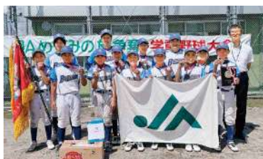
優勝 下米田ブルースターズ