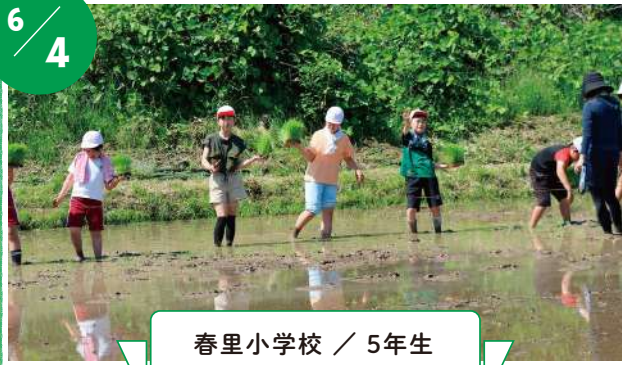
春里小学校 / 5年生