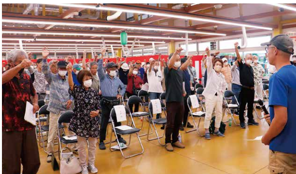
▲ガンバロー三唱で気勢を上げる出荷会員ら