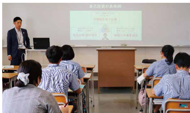
▲投資について解説する講師（左）

JAとJA岐阜信連は7月3日、関商工高校総合ビジネス科金融経済探求コースの3年生8人を対象に金融教育特別授業を行いました。