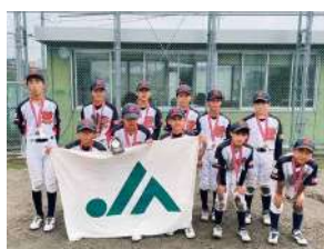
3位 加茂野ファイターズ