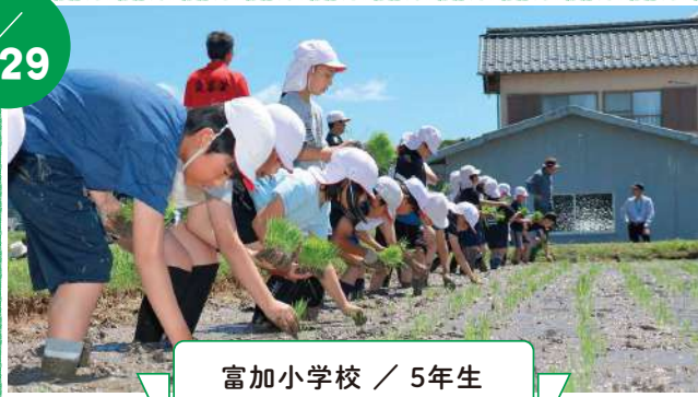
富加小学校 / 5年生