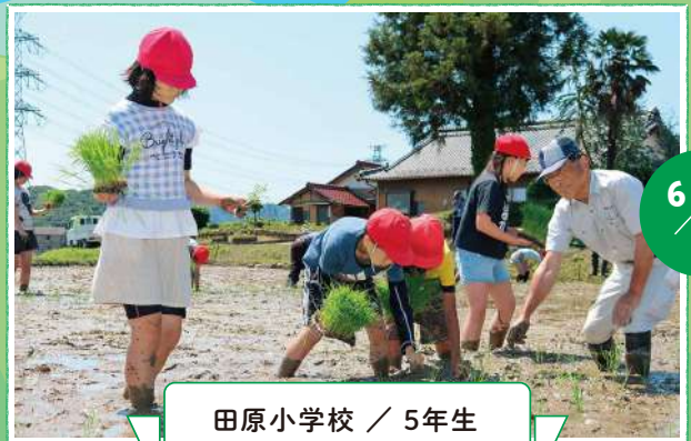
田原小学校 / 5年生