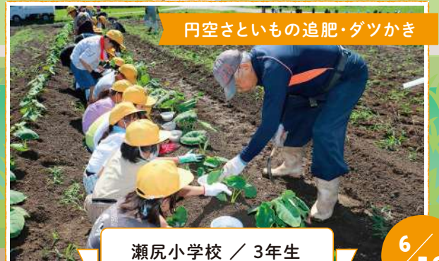
瀬尻小学校 / 3年生