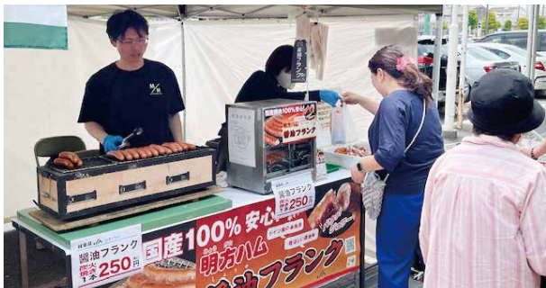
▲おんさい広場はぐり（JAぎふ）での明方ハム販売ブース

明方ハムや醤油フランクなどを製造・販売する加工事業所はショッピングサイトやホームページ、SNSを活用した情報発信に力を入れる一方で、スーパーマーケットやJA直売店などでの対面販売によるPR活動及び販売促進活動を展開しています。