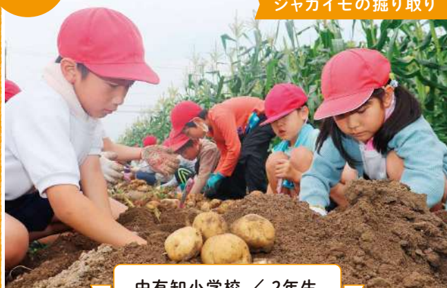
中有知小学校 / 2年生