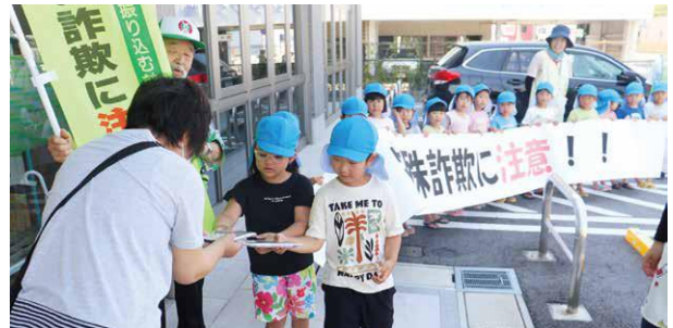
▲啓発チラシを配布する園児ら

ひすい支店は6月14日、特殊詐欺から高齢者を防ぐため加茂警察署の要請を受け、川辺第一こども園年長児15人とともに啓発活動を実施しました。園児らは来店者に啓発チラシを配布しながら、「だまされないように気を付けてね」と声をそろえて呼びかけました。