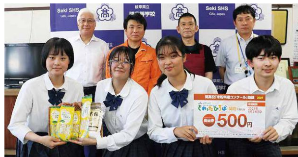
▲研究助成式の様子

JAは、関高校が米粉普及活動の一環として行う「米粉料理コンクール」の取り組みを支援しています。7月5日に行われた研究助成式では、食材の購入助成として、とれたっひろば関店で使用できる1人500円分の商品券を贈呈しました。2018年より実施している同コンクールは今年度で7回目となり、2年生267人が夏休みの課題として米粉や米粉パスタと地元食材を使ったレシピ考案に取り組みます。