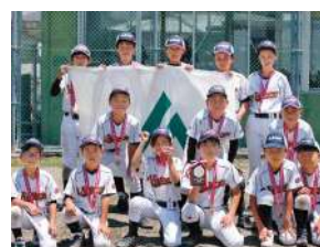
3位 山之上ビクトリーズ