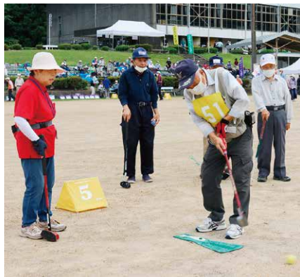
JAめぐみの杯グラウンド・ゴルフ大会

の信頼確保に資するため、事務研修や巡回活動を通じて内部管理態勢の強化に努めました。