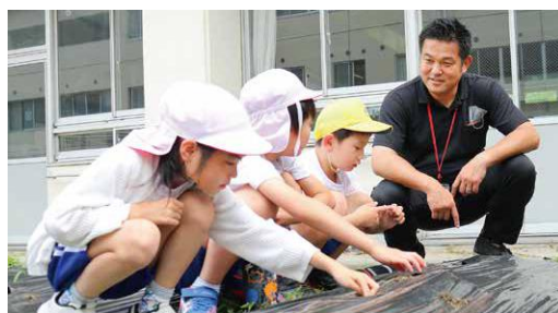
桜ヶ丘小学校3年生