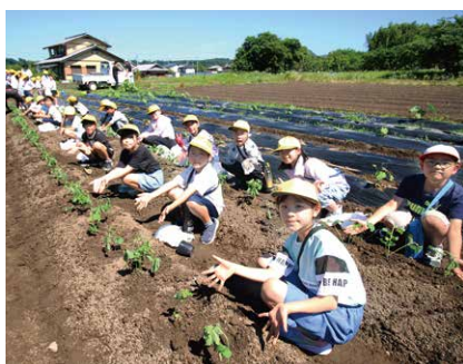
下米田小学校3年生