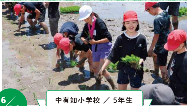
中有知小学校 / 5年生