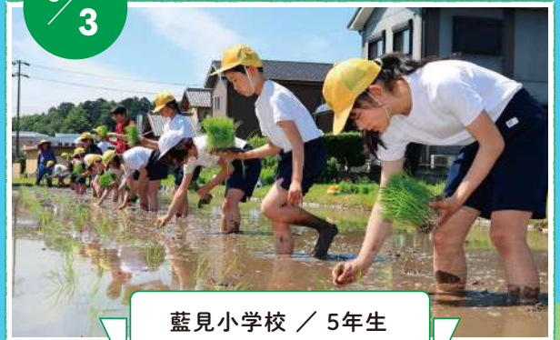
藍見小学校 / 5年生