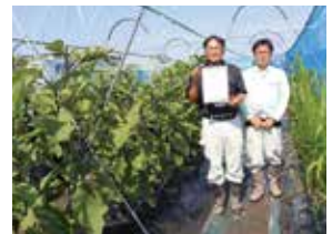
夏秋ナスでぎふ清流GAPを取得した実証圃場

食の安全・安心確保に向けて、農産物の生産情報の開示を行えるよう生産履歴記帳運動、生産工程管理(GAP)を推進しています。