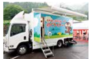
移動金融店舗「めぐライナー」

中山間地ではガソリンの供給やスーパーマーケットによる買い物支援、信用事業を行う移動金融店舗を導入するなど、地域のライフライン機能の一翼を担っています。