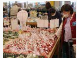
とれったひろばでのイベント

食と農、地域とJAを結び拠点としてファーマーズマーケット「とれったひろば」を運営しており、各種イベントの開催や畑での収穫体験を行っています。