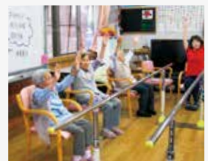
デイサービスで体操を行う利用者

地域福祉を支援するため、通所介護事業、訪問介護事業、福祉用具貸与事業、居宅介護事業を行っています。また地域医療と連携し、介護人材の育成に取り組んでいます。