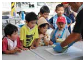
親子で栽培や収穫等を体験する「とれっただキッズ農業体験」

食や農の大切さを伝えるため、管内小学校と連携して稲作体験や特産農産物の学習を行うほか、親子で参加する「とれっただキッズ農業体験」や「春里キッズ農業体験」を行っています。