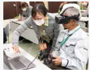
就農塾では年12回の講習を行う

新規就農者支援活動として、郡上トマトの学校、実証圃場、就農塾で就農に向けた研修を行っており、関係機関と協力し、就農準備から就農後の経営までの支援を行っています。