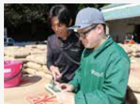
郡上特別支援学校と連携し、米の水分検査を実施

農業における労働力不足と福祉における就労機会不足を解決する試みとして、岐阜県郡上特別支援学校と連携し、卒業後の社会参加と自立を目指し、働く力の育成に取り組まれました。