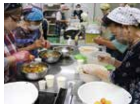
女性部による梅漬け講習会

女性の社会参画を支援するため、管内の5地域で女性部を組織しています。小学生を対象に行う食農教育活動、交流活動、農産加工品の開発、趣味の活動等を行っています。