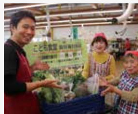
子ども食堂に食材を寄贈

ファーマーズマーケット「とれっただひろば関店」から管内の養護施設・子ども食堂に毎月、地元の野菜や加工品、乳製品、精肉などの食材提供を行っています。